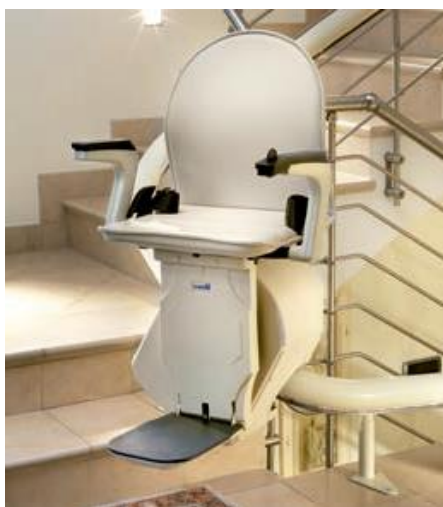
PLUS (de serie)