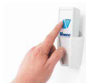
(1) Mando exterior