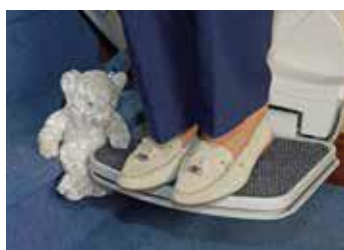
(3) Máxima Seguridad