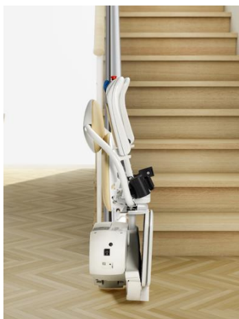
Asiento, brazos y rodapiés plegables (4)