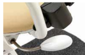
(2) Rotación asiento